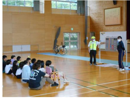
浜島小で交通安全教室(浜島)