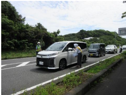
冷茶キャンペーン(志摩)