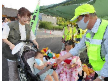
志摩の夏祭り啓発活動(阿児)