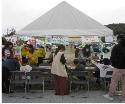
TOBAひだまりフェスタ(鳥羽)