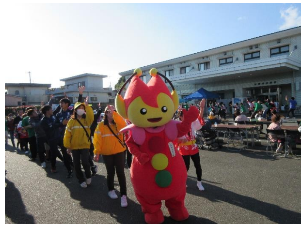
志摩市民病院まつり啓発活動(「子ども制服」で記念写真と「じゃこっぺ踊り」にストッピーと参加)