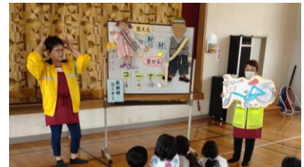
ささゆりキッズ交通安全教室(磯部)