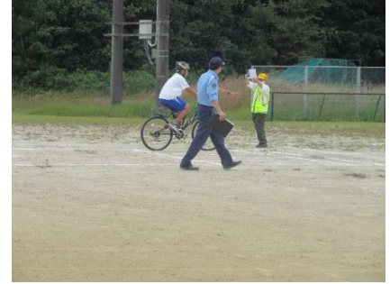
大王中で自転車交通安全教室(大王)